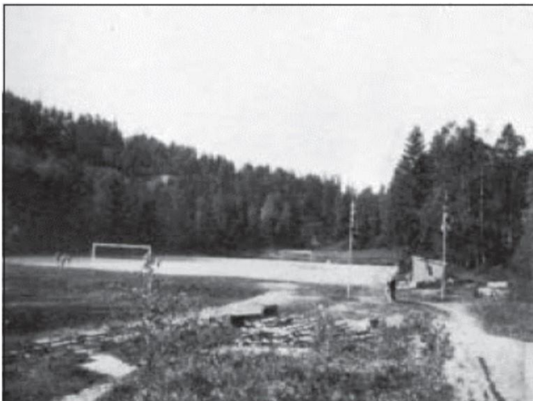
Hemingbanen anno 1925

Heming ble stiftet i 1916, og myren på Gråkammen lå og ventet på dugnadsglade fedre. Fotball var populært, og så småningom kunne de ta jordet i bruk med ball. I 1922 hadde Heming 89 medlemmer. Klubbens fotballgruppe ble fra dette året tilknyttet den organiserte idrett ved innmelding i Kristiania Fotballkrets, og spilte sin første kretskamp i 1923. Klubben fikk også sin egen avis. Der kunne vi i mai 1922 lese: «Sportsplassen på Graakammen har vært et skjæbnens stebarn de aar den har eksistert. Saa vakker som den ligger omkranset av løv- og barskog og skjermet paa alle kanter mot vind og storm, er den imidlertid til at bli noget stort. Hvor meget og hvor lenge et par stivbente og stivsindete grander enn stritter imot, maa og skal det lykkes at gjøre Graakammen til det ungdommens samlingssted, som Holmenkolgrænden nu savner saa dybt.»